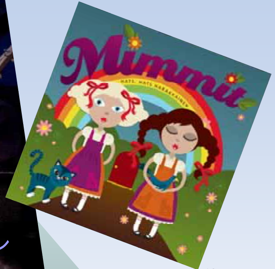
子供向けアルバム 今秋発売

2008年 10月25日(土) 17:30 ~ (大人向け) 26日(日) 13:00 ~ (親子向け)